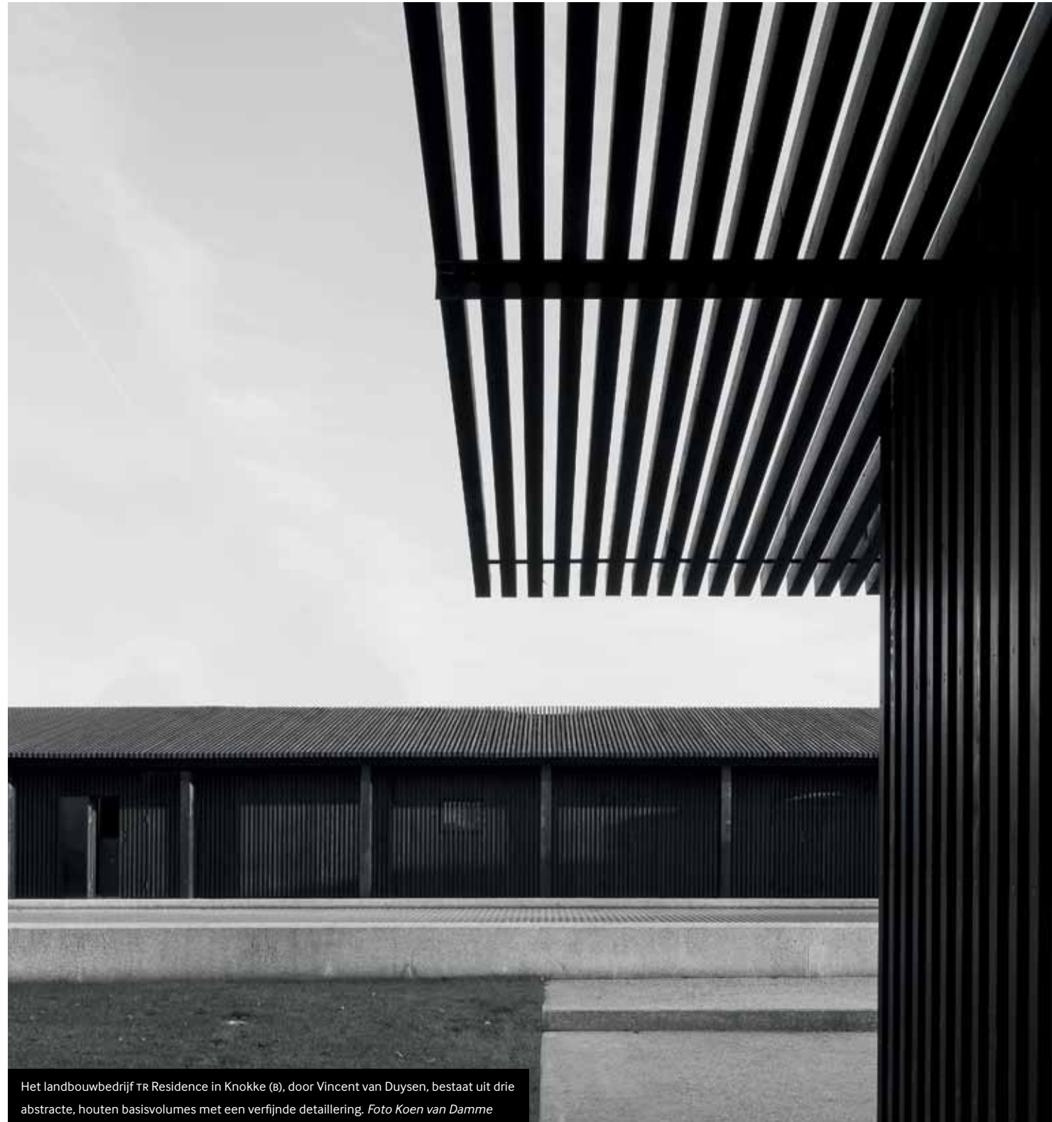
Het landbouwbedrijf TR Residence in Knokke (B), door Vincent van Duysen, bestaat uit drie abstracte, houten basisvolumes met een verfijnde detaillering.

Woonhuizen en infrastructuurprojecten domineerden dit jaar de inzendingen voor de ARC15 Architectuur Award. Willen projecten duurzaam zijn, dan zullen beeld, proportie en ruimte moeten aansluiten op het gebruik ervan. Met dit in het achterhoofd, selecteerde de jury onder leiding van Kees Kaan uit 114 inzendingen vier projecten die een breed scala van de hedendaagse architectuur beslaan. Na een spannende finale werd TR Residence door Vincent van Duysen als winnaar voorgedragen.