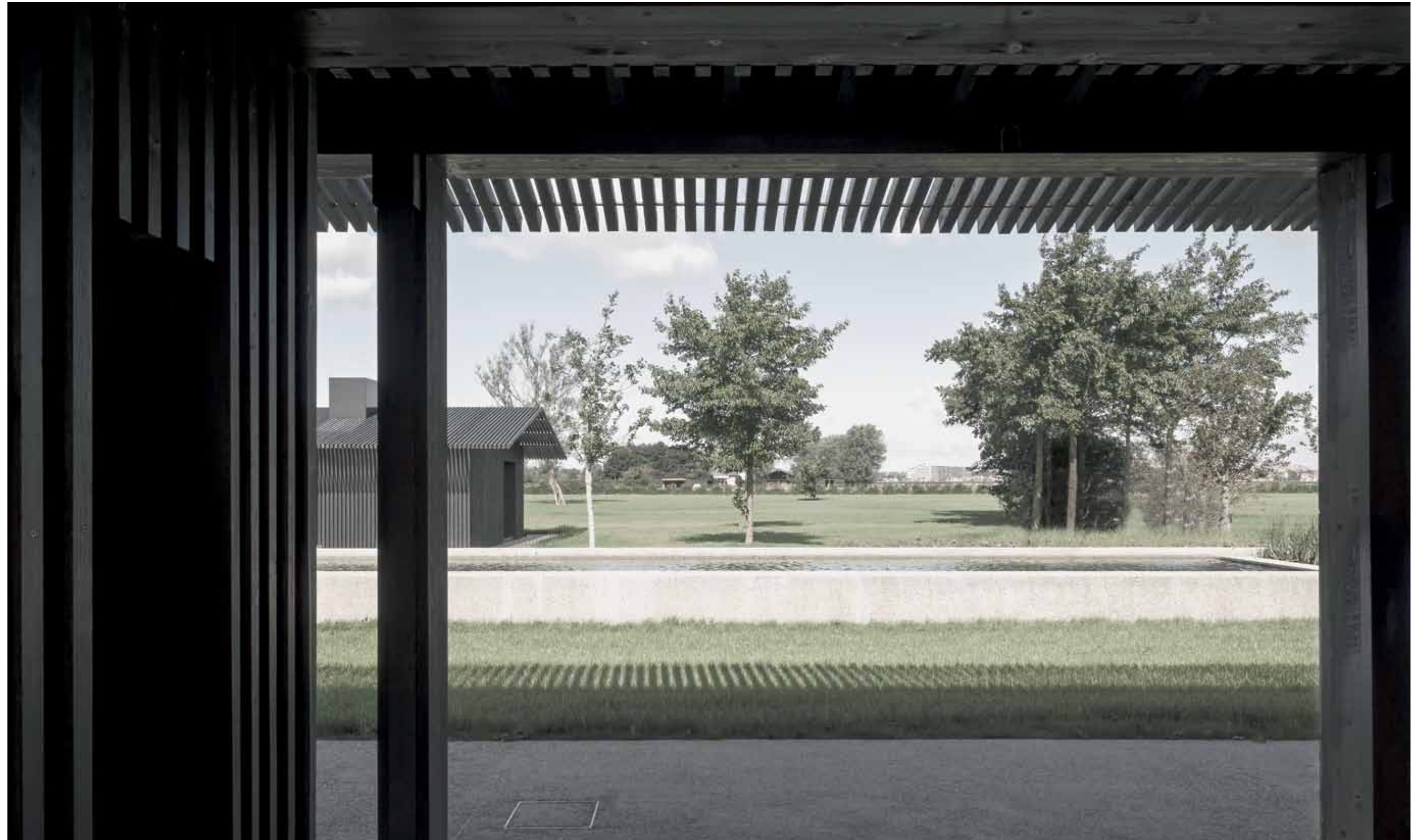
De winnaar van de ARC15 Architectuur Award is TR Residence in Knokke door Vincent van Duysen.

Uiteindelijk kiest de jury met meerderheid van stemmen voor het project dat met adequate middelen een precies antwoord geeft op de opgave en dat daarbij een grote passie voor programma en vakmanschap aan de dag legt. De winnaar van ARC15 Architectuur Award is TR Residence in Knokke door Vincent van Duysen.