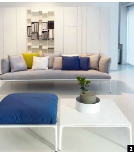
1. "Le Banc" en "La Grande Table", Xavier Lust voor MDF Italia. 2. In Milaan presenteerde Jean-Marie Massaud een nieuwe versie van sofa "Yale".