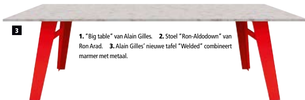
1. "Big table" van Alain Gilles. 2. Stoel "Ron-Aldodown" van Ron Arad. 3. Alain Gilles' nieuwe tafel "Welded" combineert marmer met metaal.