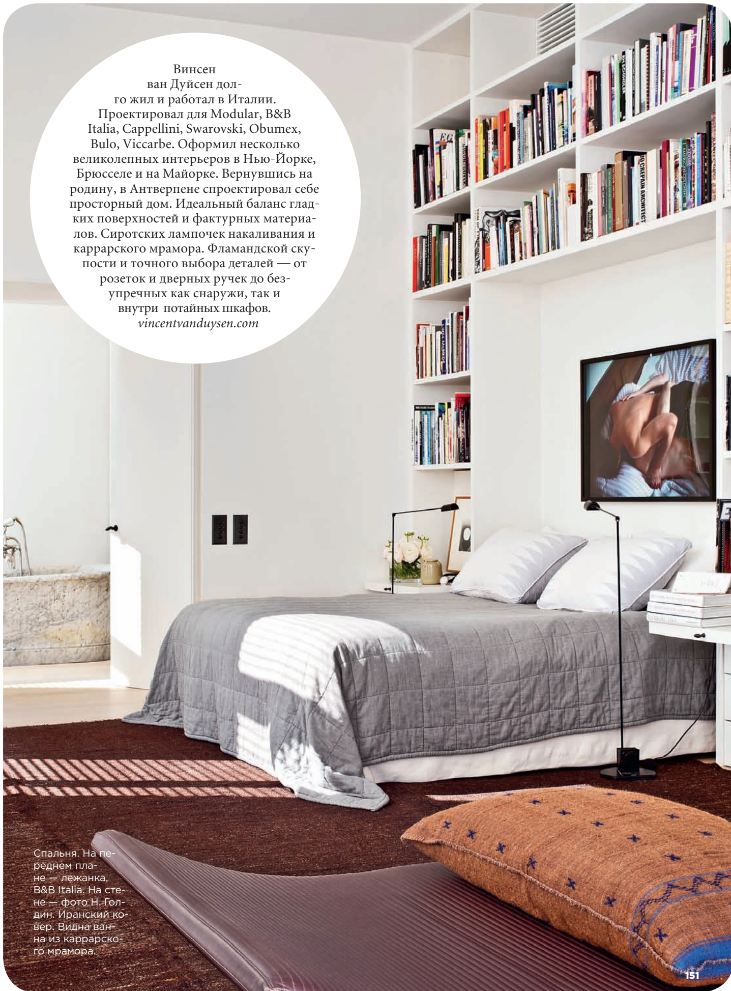
Спальня. На переднем плане — лежанка, V&V Italia. На стене — фото Н. Голдин. Иранский ковер. Видна ванна из каррарского мрамора.