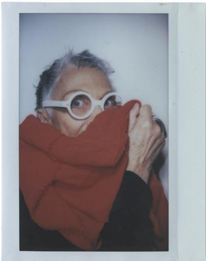
PAOLA NAVONE - ARCHITETTA E DESIGNER, OTTO STUDIO