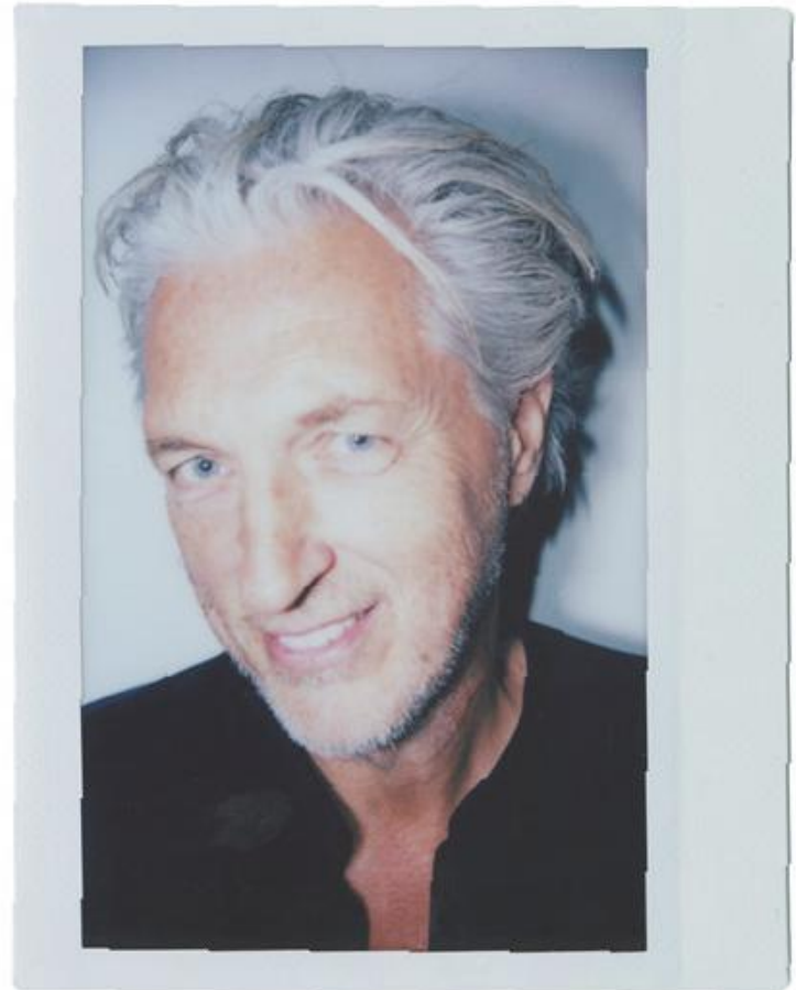
MARCEL WANDERS - DESIGNER