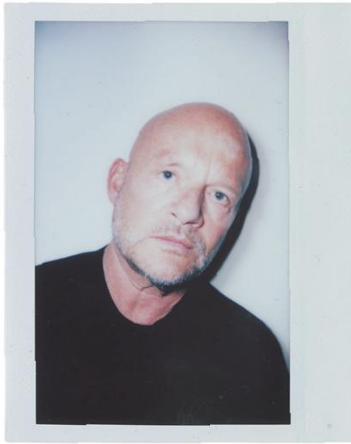
VINCENT VAN DUYSEN - ARCHITETTO E DESIGNER