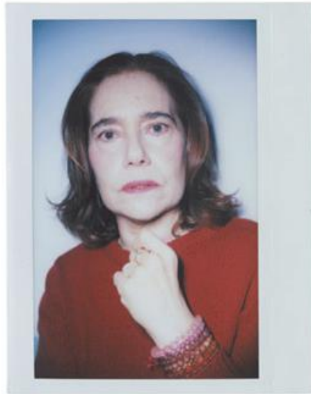
FUDIA MENDINI - STUDIO E ARCHITETTO ALESSANDRO MENDINI