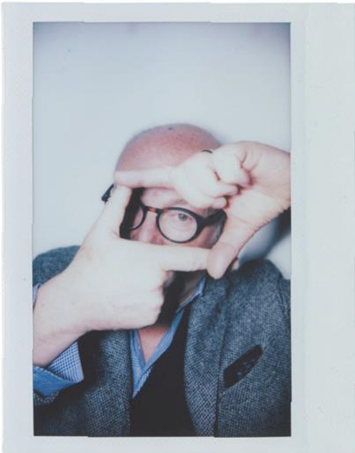
PIERO LISSONI - ARCHITETTO E DESIGNER