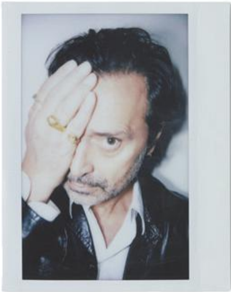
FABIO NOVEMBRE - ARCHITETTO E DESIGNER