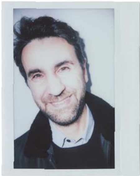
JOSEPH GRIMA - ARCHITETTO E DESIGNER, ALCOVA