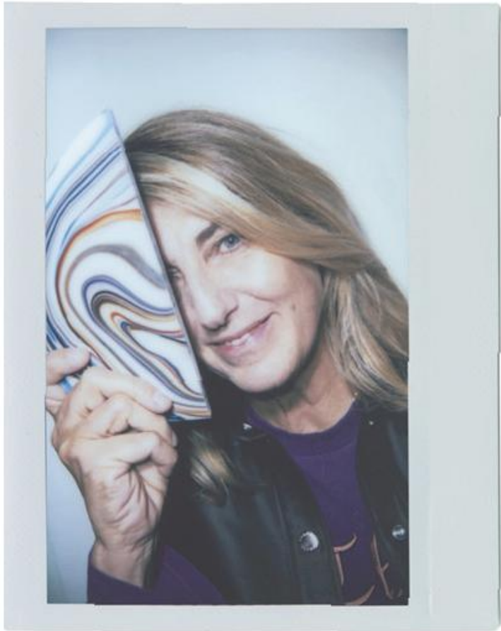
PATRICIA URQUIOLA - ARCHITETTA E DESIGNER