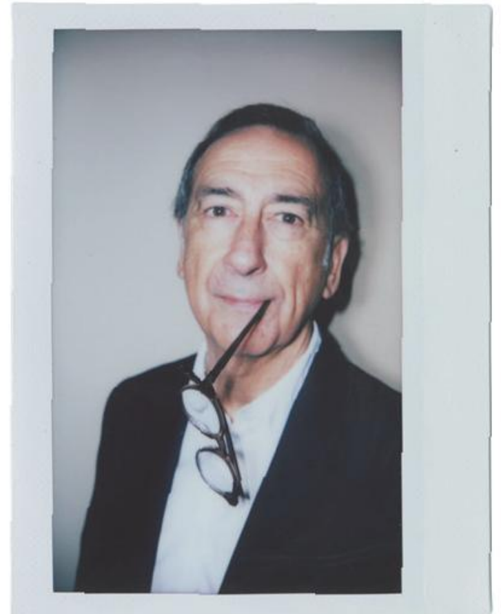
BEPPE SALA - SINDACO DI MILANO