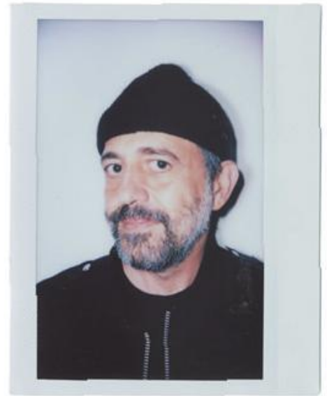
MICHAEL ANASTASSIADES - DESIGNER