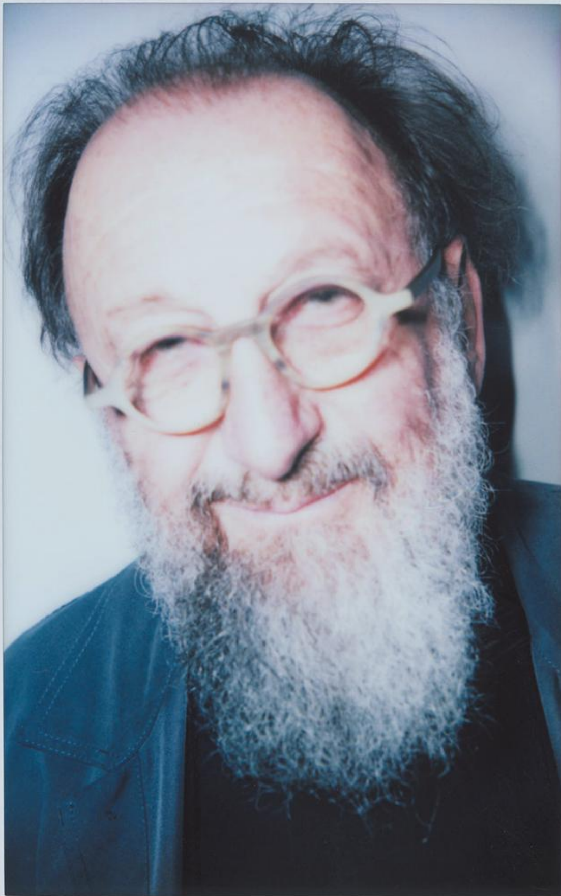
MICHELE DE LUCCHI - ARCHITETTO E DESIGNER, FONDATORE AMLD CIRCLE