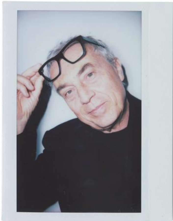
STEFANO BOERI - ARCHITETTO, PRESIDENTE DI TRIENNALE MILANO