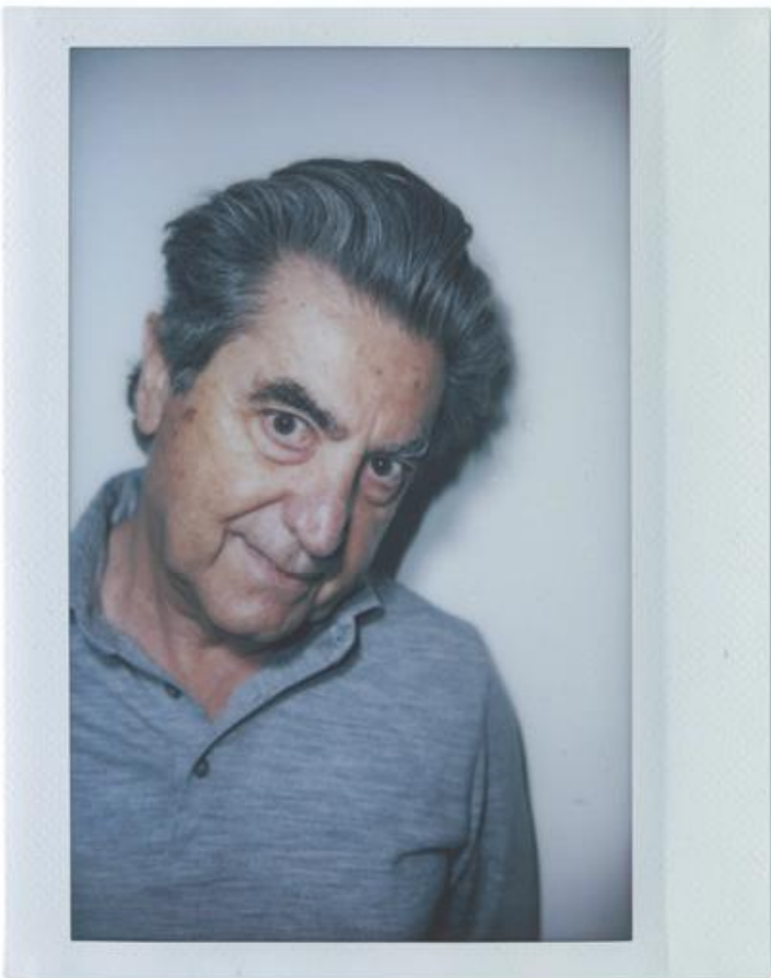
ANTONIO CITTERIO - ARCHITETTO E DESIGNER, ACPV ARCHITECTS