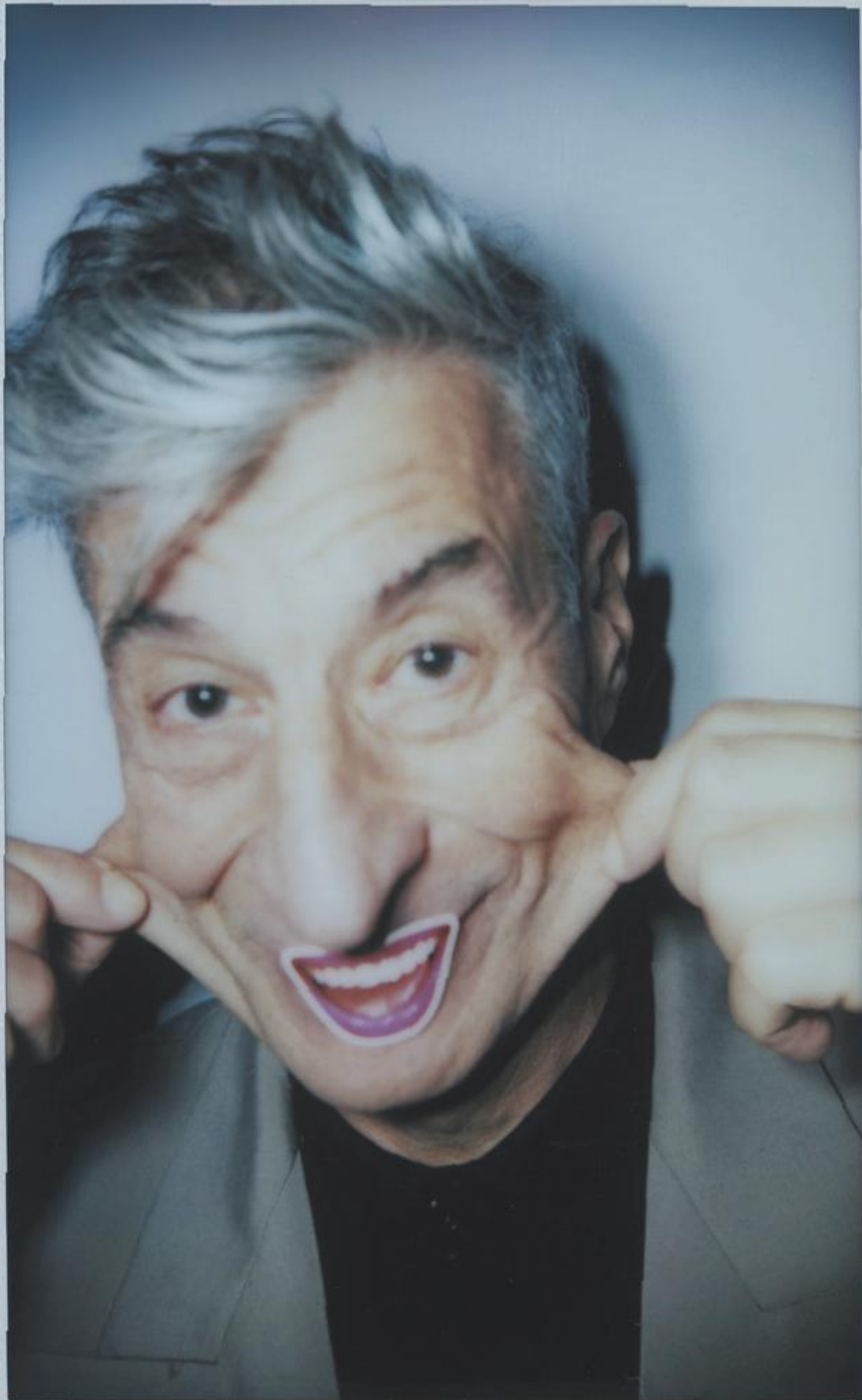
MAURIZIO CATTELAN - ARTISTA, TOILETPAPER