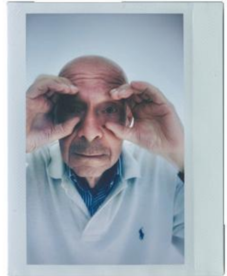
MARIO BELLINI - ARCHITETTO E DESIGNER