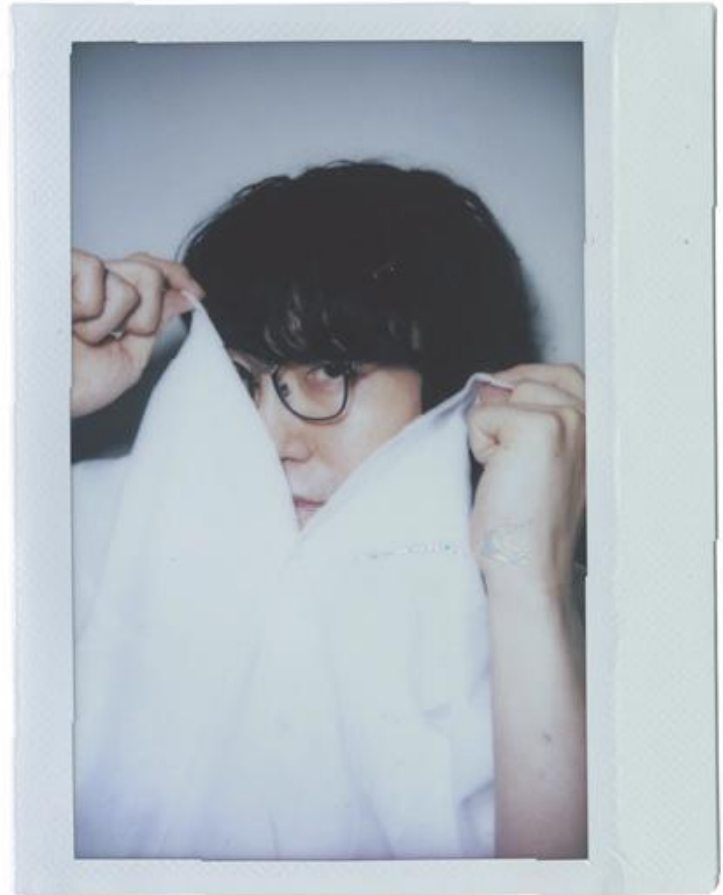
OKI SATO - ARCHITETTO E DESIGNER, STUDIO NENDO