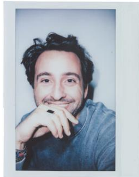
GABRIELE CAVALLARO - ISOLA DESIGN DISTRICT