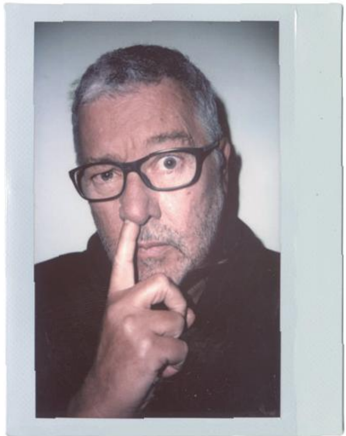
PHILIPPE STARCK - ARCHITETTO E DESIGNER