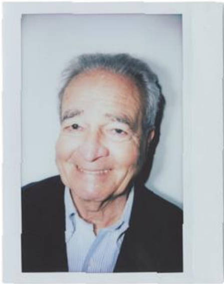
ALBERTO MEDA - DESIGNER