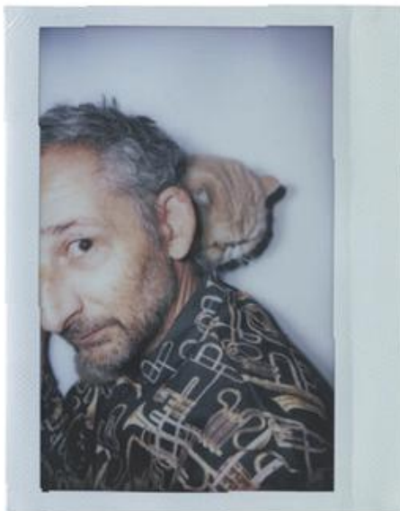
PIERPROLO FERRARI - FOTOGRAFO, TOILETPAPER