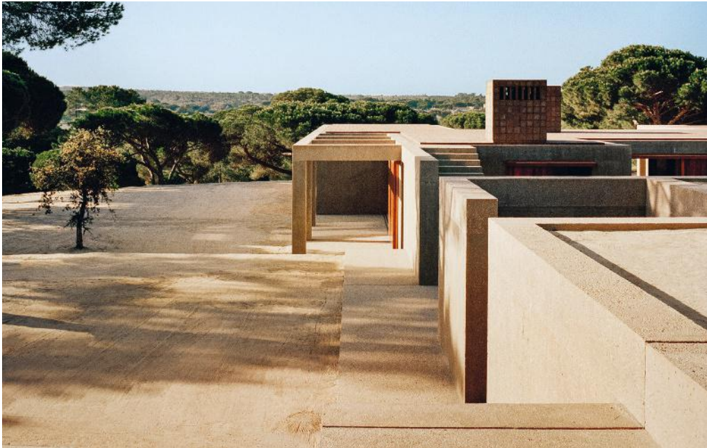
Blick auf die Casa M in Melides. Der mit Ziegeln verkleidete Kamin ist typisch für die portugiesische Architektur. Unten Von Van Duysen gestaltetes Loft-Apartment im dritten Stock eines ehemaligen Gewürzlagers in Antwerpen. Rechte Seite Blick in das Schlafzimmer mit angrenzendem Bad in Van Duysens Haus in Antwerpen: Gegenüber dem Bett steht eine afrikanische Skulptur, eine Schutzgottheit im Dialog mit einem anderen Maskengesicht von Thomas Houseago.