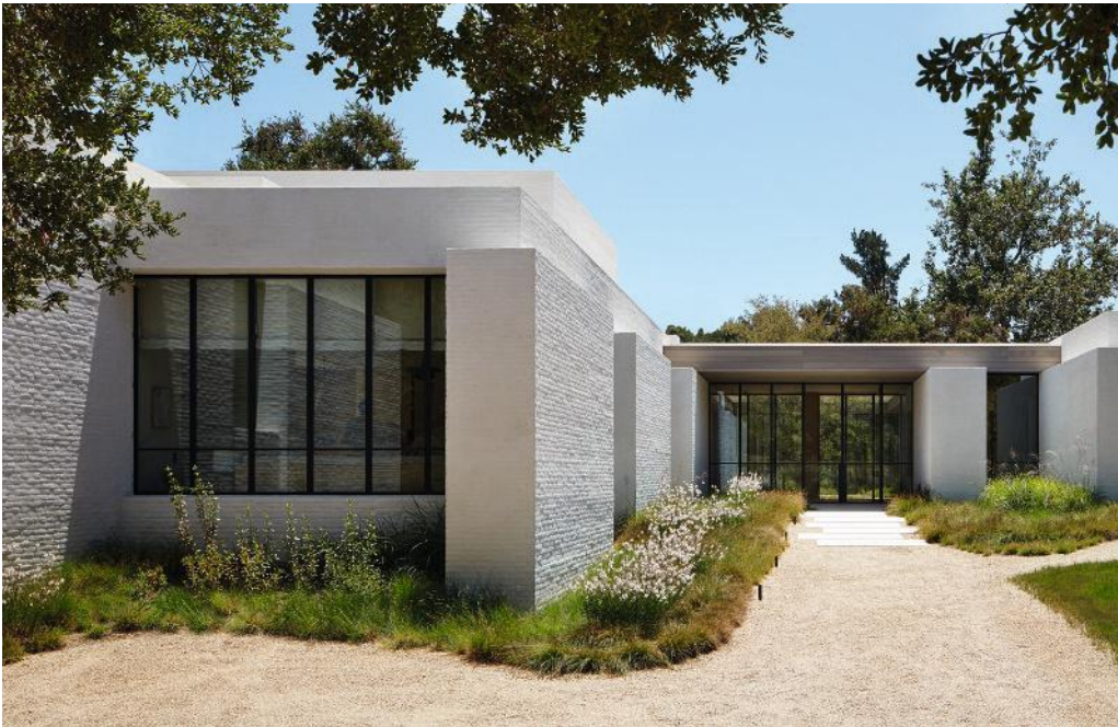
Oben Die Fassade dieses einstöckigen Van-Duysen-Hauses in Brentwood, Los Angeles, ist inspiriert von belgischen Ziegeltechniken. Unten Mid-Century-Modern-Zitate und Stücke von José Zanine Caldas und ein Beistelltisch, der afrikanische Stammeskunst evoziert in Van Duysens Casa M in Melides.