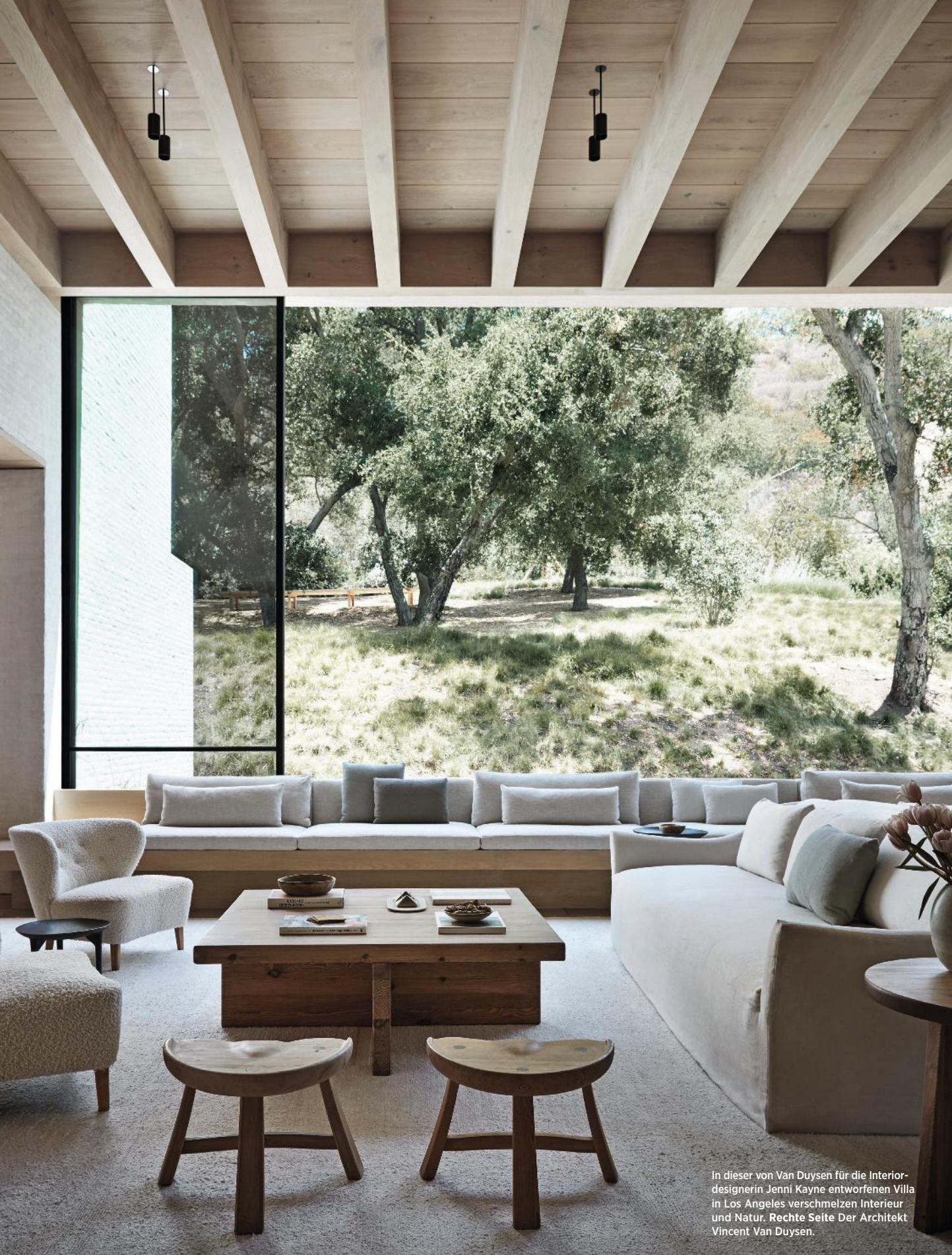
In dieser von Van Duysen für die Interior-designerin Jenni Kayne entworfenen Villa in Los Angeles verschmelzen Interieur und Natur. Rechte Seite Der Architekt Vincent Van Duysen.