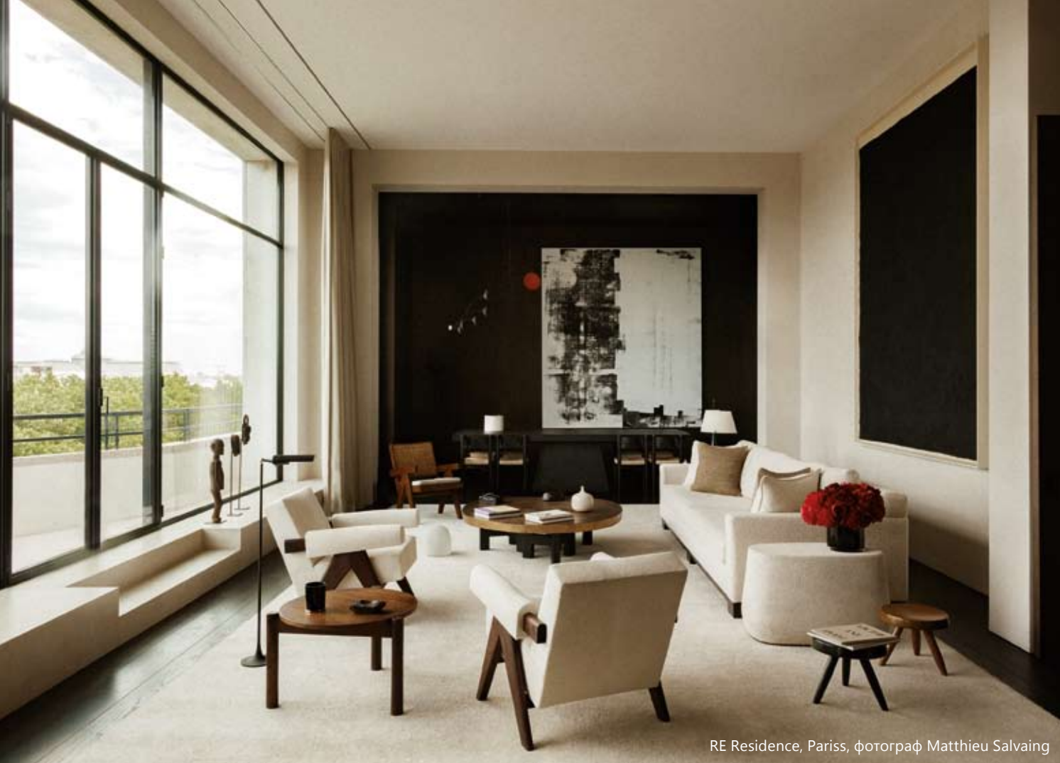
RE Residence, Pariss, фотограф Matthieu Salvaing

– Как съвременната архитектура трябва да се справи и да реагира на все по-динамичното ежедневие, на тенденции и мода?