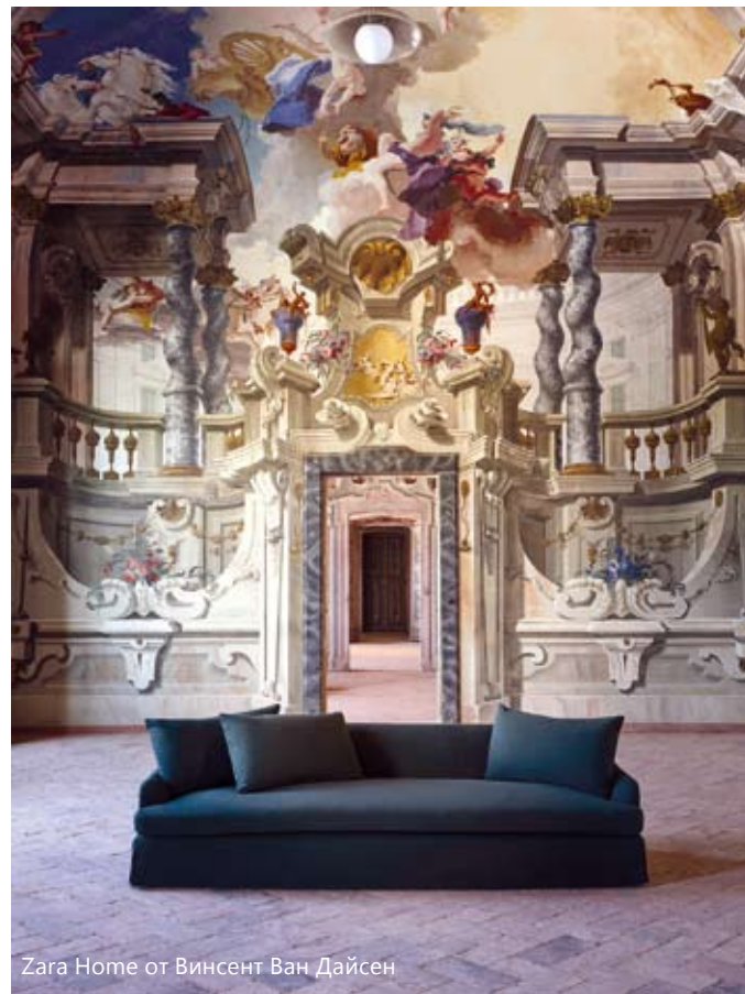
Zara Home от Винсент Ван Дайсен