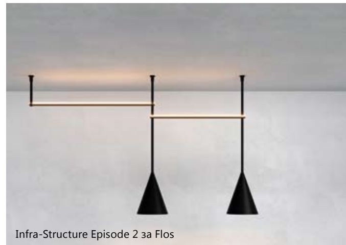
Infra-Structure Episode 2 за Flos

– Да започнем с бъдещето – кои са най-новите и интригуващи проекти, по които работите, какво да очакваме?