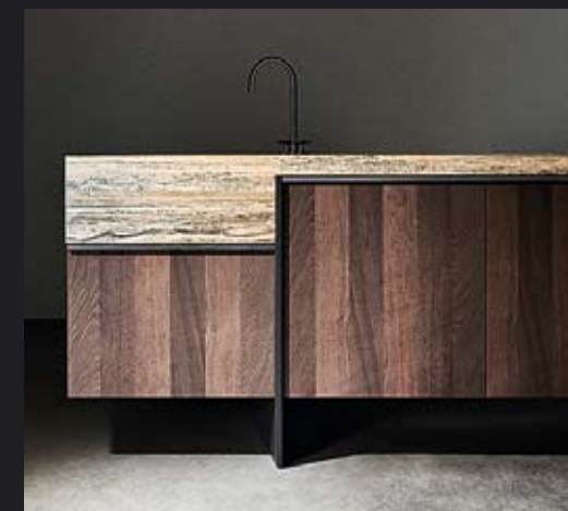
Ratio за Molteni&C