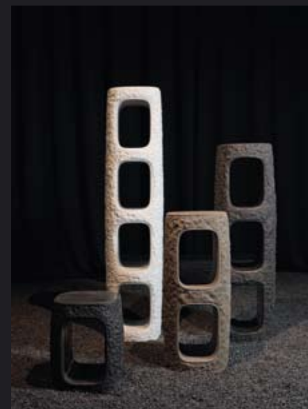
Gravitas за ARCA