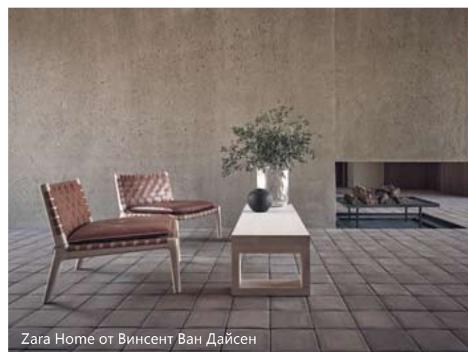
Zara Home от Винсент Ван Дайсен

– Става съвсем органично и спонтанно. Понякога полагаме началото на сътрудничеството чрез препоръки, понякога първо се запознаваме и след това започват да ми се доверяват и следват моите архитектурни и дизайнерски идеи и философия. Понякога те просто се влюбват в някой от старите ми проекти и се свързват с мен... В някои от случаите с марките, с които работя – те стават фенове на работата ми, опознават моя свят, моите жилища и чувстват, че мога да бъда правилният човек, с когото да тръгнем на съвместно творческо пътуване. Няма правило, което да отговаря на всички.