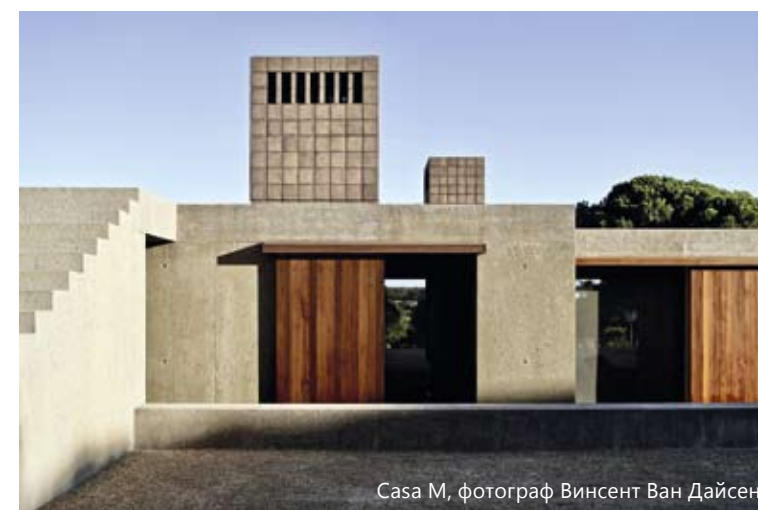
Casa M, фотограф Винсент Ван Дайсен

– В моя случай това е целият Антверпен. Макар и малък град, той има дълбоки и силни творчески корени, много е жизнен! Той е космополитен както в изкуствата, така и в културата и има огромно разнообразие от творчество – театър, представления, танци, мода, архитектура. Населен е с много уникални и разнообразни хора. Освен това Антверпен с разнообразието си от таланти ми позволи да събера страхотния екип във VVDA.