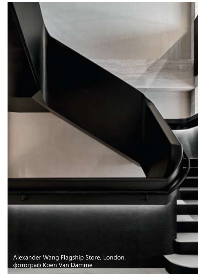
Alexander Wang Flagship Store, London