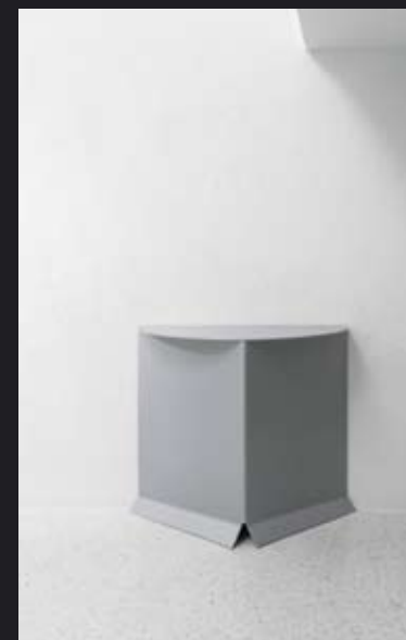
I.R.O. за Giustini Stagetti