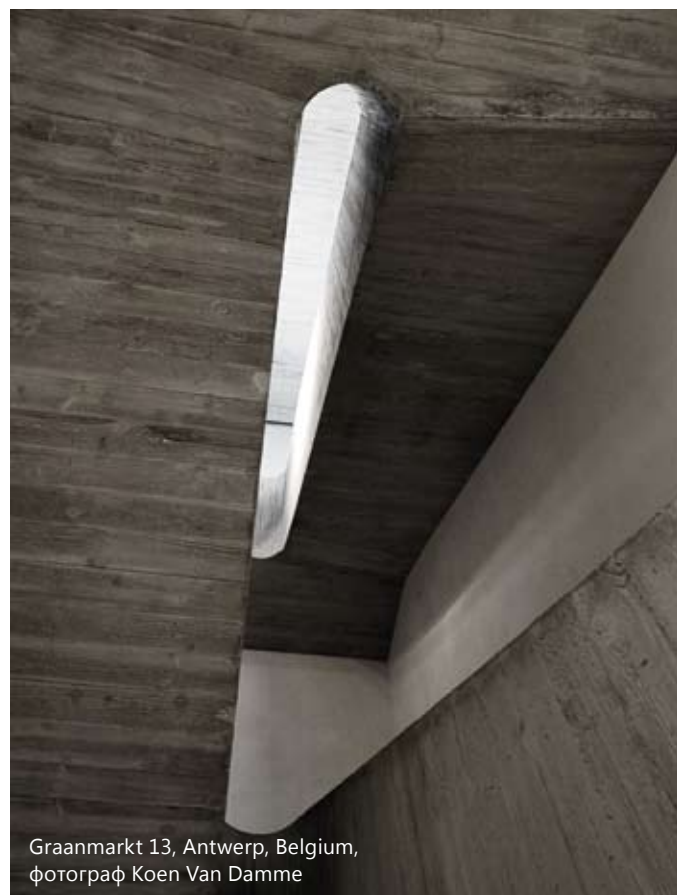
Graanmarkt 13, Antwerp, Belgium