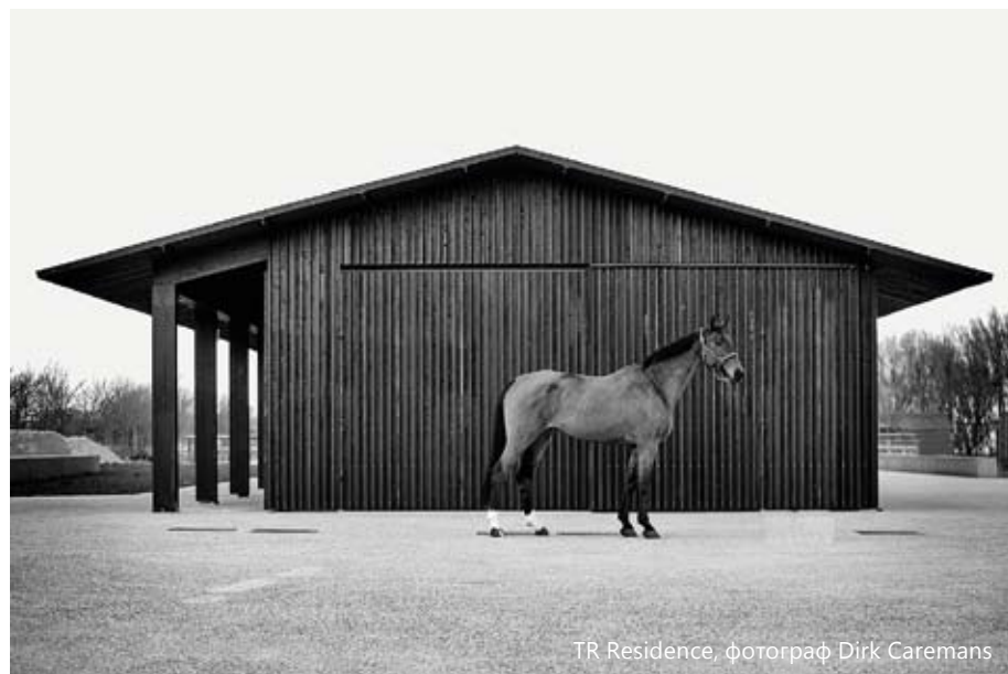
TR Residence