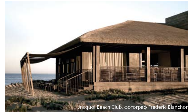
Jncquoi Beach Club

– Коя е вашата любима зона в жилищното пространство, на която обръщате специално внимание?