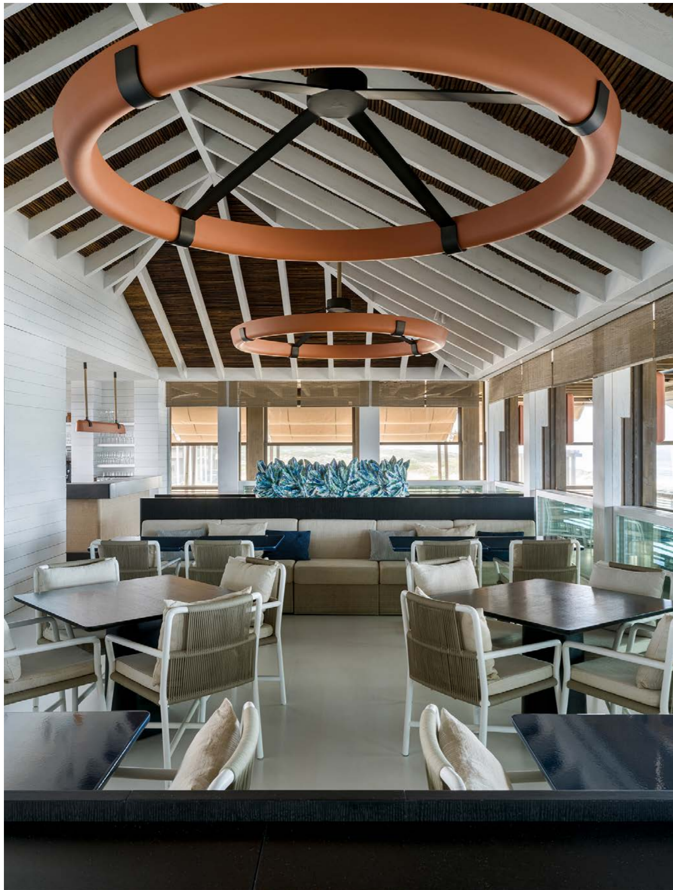
JNCQUOI BEACH CLUB, COMPORTA, PORTUGAL