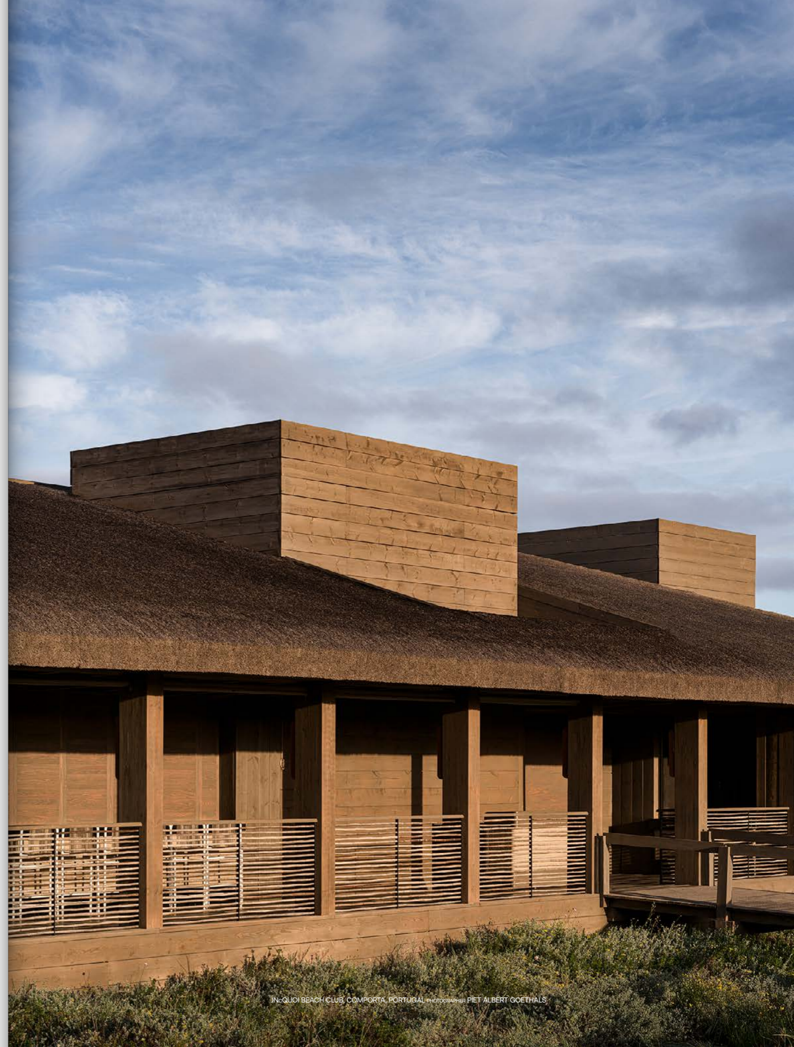
JNCQUOI BEACH CLUB, COMPORTA, PORTUGAL