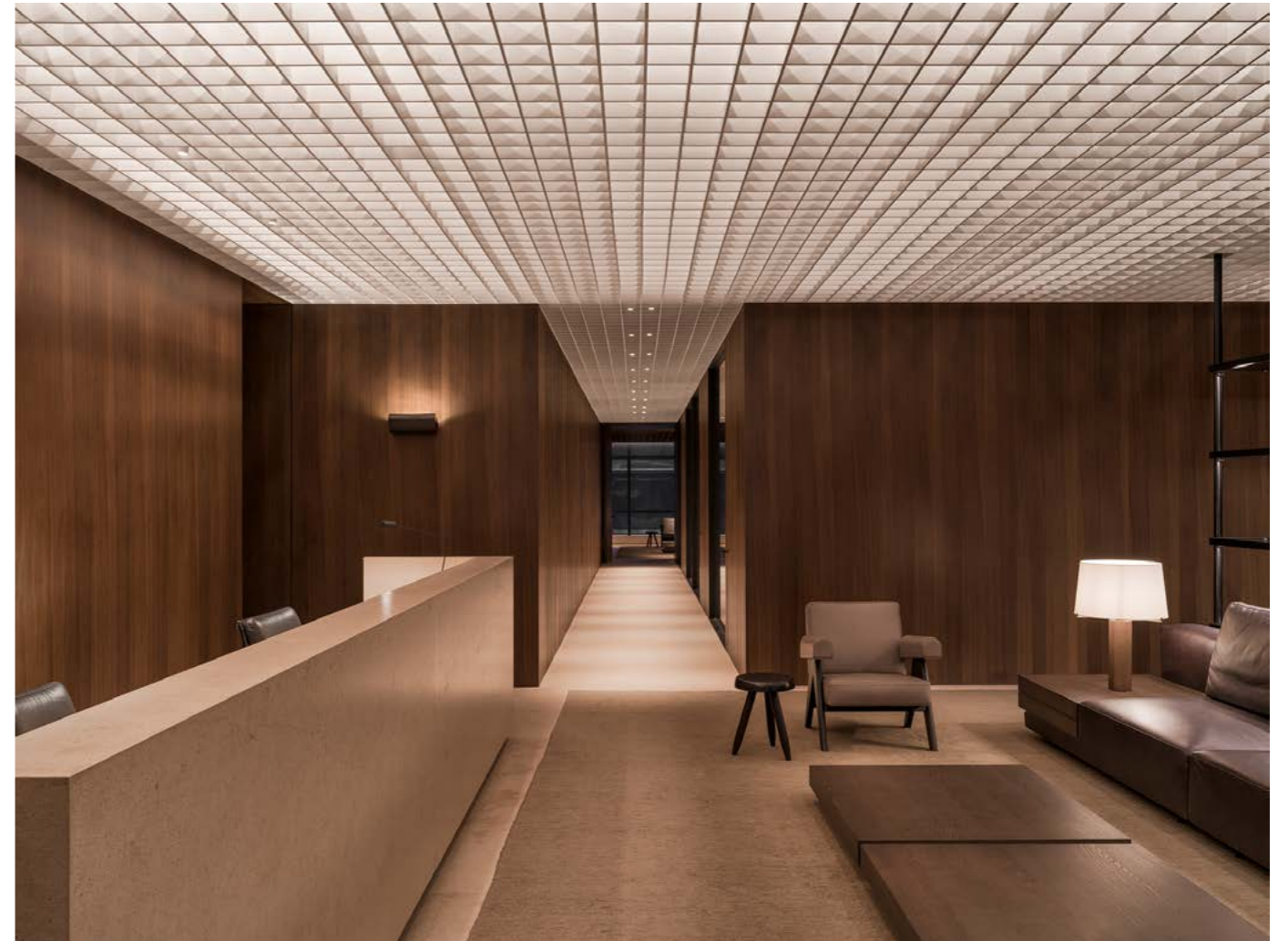
M OFFICES, NEW DELHI INDIA