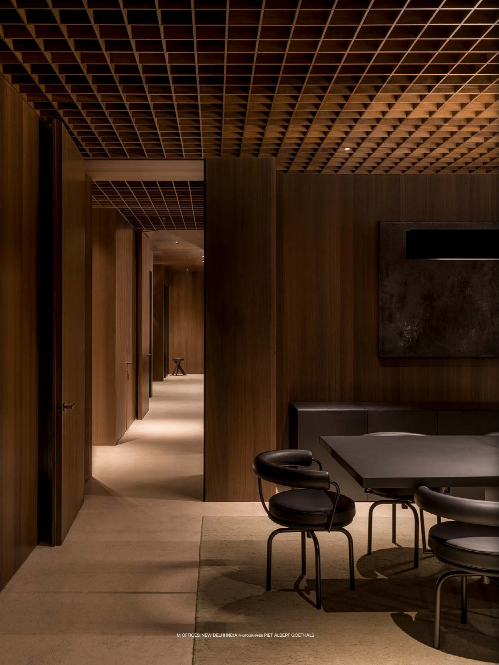
M OFFICES, NEW DELHI INDIA