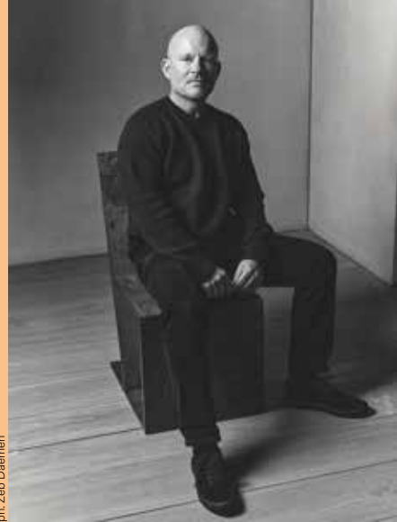
ph. Zeb Daemen